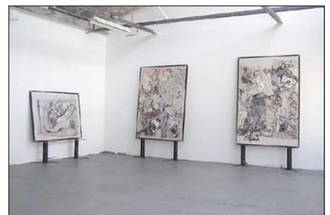
Bild von 1997 und zwei Bilder von 2005