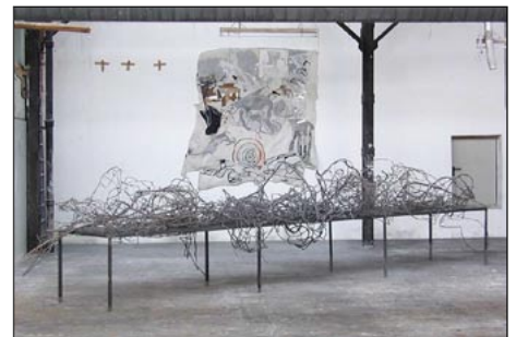
Tisch (2004/05) und Bild (1997)