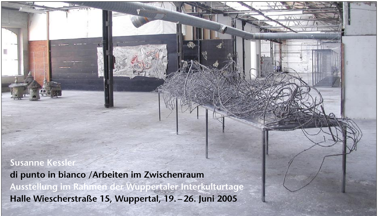
Susanne Kessler di punto in bianco /Arbeiten im Zwischenraum Ausstellung im Rahmen der Wuppertaler Interkulturtage Halle Wiescherstraße 15, Wuppertal, 19.–26. Juni 2005