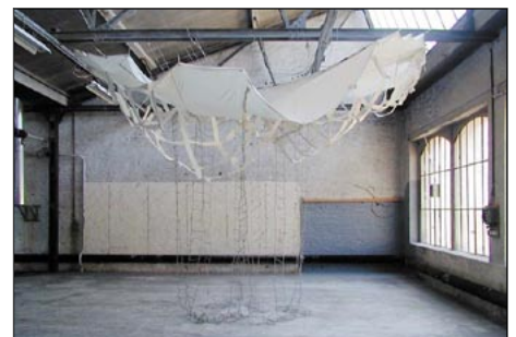
oben und unten: Survival Kit (2005)