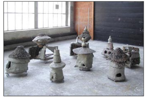
aus: „Wenn die Flüsse rückwärts fließen“ (1998)