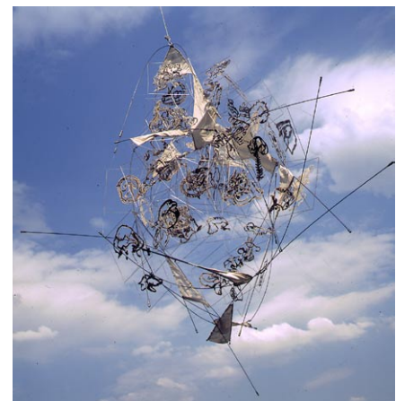
Bilancia Anfibia, Bonn 1998

Diese Angelkonstruktion interessiert mich seit Jahren. 1995 verkauften mir dann die Fischer eine fünfzigjährige marode und verrostete Fischerwaage. Ich baute sie Schritt für Schritt auf der Isola Sacra ab, verpackte alle Einzelteile, um sie nach Dänemark zu transportieren, wo sie dann wieder neu zusammengesetzt wurde. Dies war mein Beitrag zur dänischen Ausstellung »Peacesculpture – 50 Jahre nach der Befreiung Dänemarks vom deutschen Nationalsozialismus«. Eine banale Fischerkonstruktion mit großem Aufwand von Süden nach Norden zu transportieren, sie auf einem ebenfalls 50 Jahre alten, halb im Sand versunkenen Bunker zu montieren und einzuzementieren, war »Ready-made« und »Happening« zugleich. Das Wehen und Flattern der an der Bilancia angebrachten überdimensionalen Netze glich einer Neubeflaggung, doch diesmal mit friedlicher Absicht. Auf den Netzen hatte ich Zeichnungen des menschlichen Innenohrs angebracht, die Menschwerdung, Fragilität und Verständigung symbolisierten. Der Bunker sollte auf diese Weise für einen begrenzten Zeitraum dem Organischen und Vergänglichen übergeben, seine massige Brutalität aufgelöst werden.